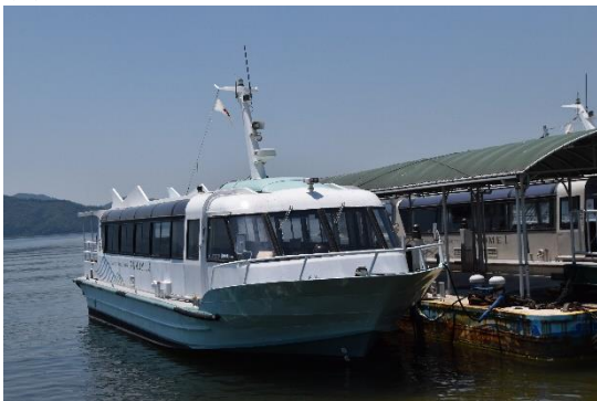
停泊中の「かもめ3」で、「かもめ1」と同型船です。