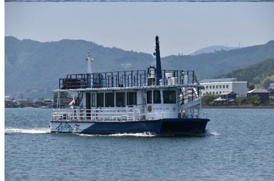
一の宮棧橋に入港する「かもめ11」です。「かもめ13」の同型姉妹船で、19総トンです。