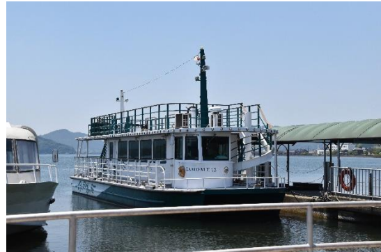
停泊する「かもめ13」です。双胴船で、ブリッジが右舷に寄っており、船首の左舷側にはオープンデッキに登るための螺旋階段があります。