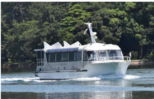
天橋立棧橋にやってきた「かもめ1」です。19総トン型で、建造は琵琶湖の空兵衛造船です。船尾にオープンデッキがあります。天橋立沿いに航海して、12分で一の宮棧橋に到着します。

玄武洞から川を下ると、有名な温泉地である城崎があります。ここは、旅館に泊まって、町中にある温泉(外湯と呼ばれています)を巡って湯治をするのが一般的です。定休日とコロナ禍で半分ほどの外湯が閉まっていたのですが、2つの温泉を楽しむことができました。