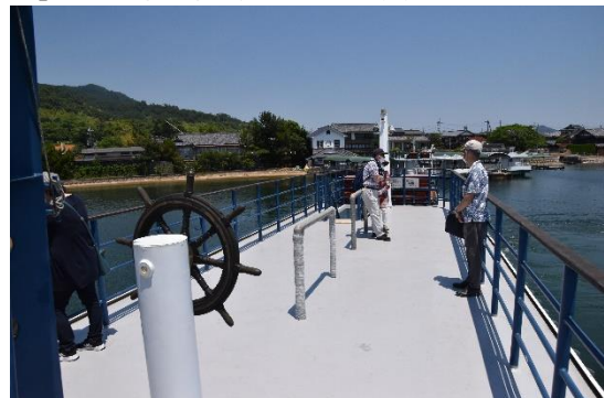
「かもめ11」のオープンデッキです。