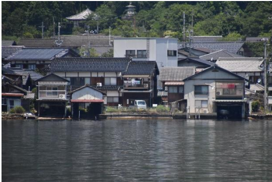
船の左舷からは家の1階が船置き場となっている「舟屋」が並んでいるのが見えました。近くの伊根町は、舟屋がたくさん残っているのが有名ですが、この天橋立の内側の阿蘇海にも残っています。