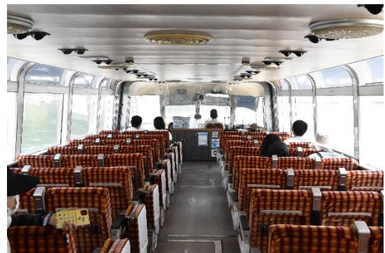
「かもめ1」の船内です。