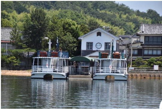
一の宮棧橋には、2つの棧橋があり、計4隻のフェリーが停泊できます。写真の2隻は「かもめ11」と「同13」です。この2隻には屋上のオープンデッキがあります。